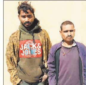
पुलिस गिरफ्त में आरोपी, ज्वंत ट्राला।

संयुक्त टीम ने मंगलवार की सुबह तड़के कार्रवाई करते हुए कोयले की अफरा-तफरी में संलिप्त ट्राला वाहन क्रमांक सीजी 15 एसी 4616 को जब्त किया है। जिसमें